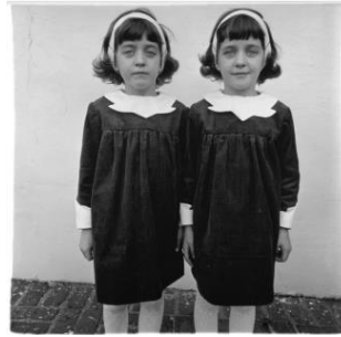
Diane Arbus, Identical Twins , 1967