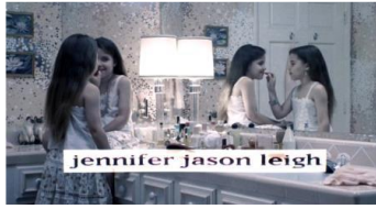
Photogramme JFPA, générique

La gémellité inquiétante : d'où vient le malaise chez le spectateur ?