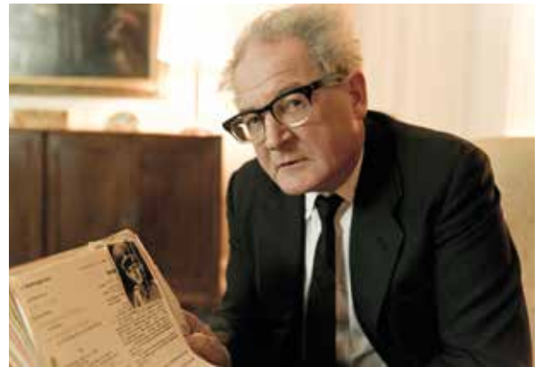
Die Akte Eichmann: Fritz Bauer (Burkhard Klaußner) mit brisantem Material.

3. weiter = autre / das Oscar-Rennen la course aux Oscars / so weit sein, etw zu tun être prêt à faire qqch / der Widerständige = der Widerständler l’opposant, le résistant / der Held(en) le héros / an-erkennen(a,a) reconnaître / aus dem Abstand à distance / in vielerlei Hinsicht à de nombreux égards / heldenhaft handeln agir de façon héroïque / der Kriegsverbrecher le criminel de guerre /