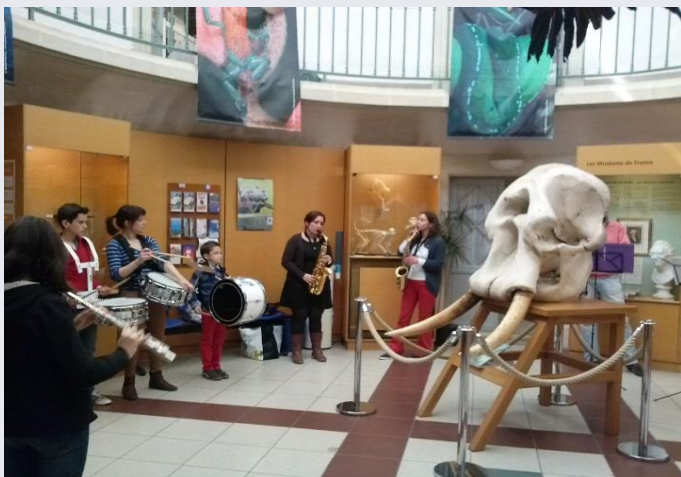
Fanfare de quartier « Appel d'airs » au Muséum