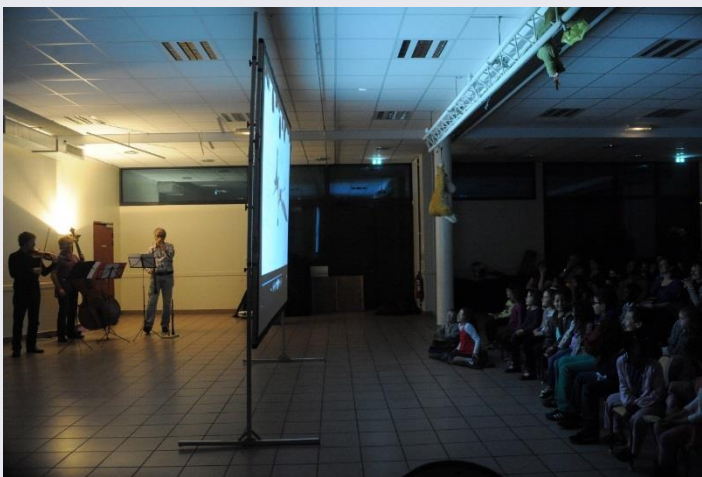
Ciné-concert au Centre Marcelle Menet

Parcours autour du concert « Le carnaval des animaux », en partenariat avec l'Orchestre National des Pays de la Loire, le Muséum des Sciences Naturelles, le Musée des beaux arts, la maison de quartier Le Quart'Ney et le Centre Marcelle Menet.