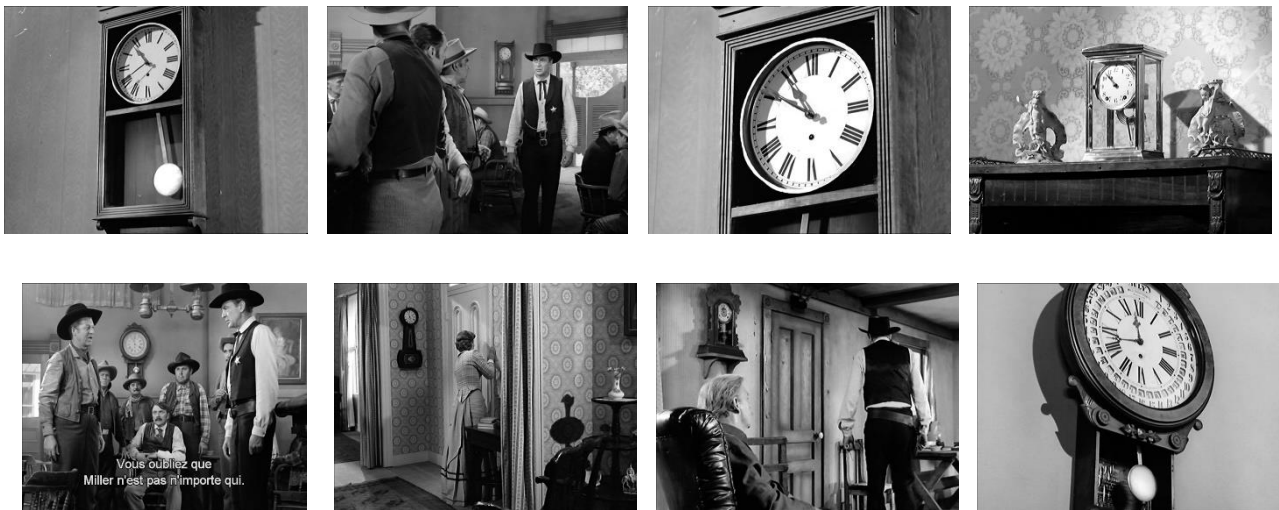
Diaporama incomplet, de nombreux plans avec des horloges sont aussi visibles.