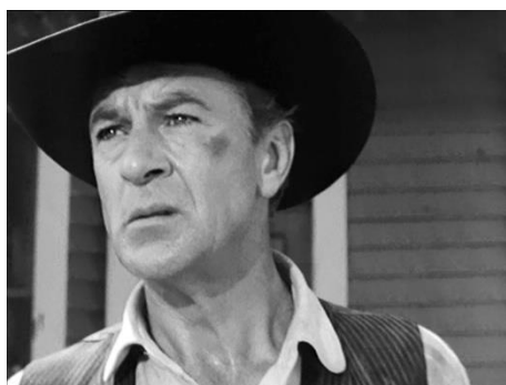
Gary Cooper, seul dans Le train sifflera trois fois 1952

https://www.youtube.com/watch?v=44zevzvl9PQ