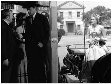
Le bureau du Marshall

« Dans les années 50 apparaît ce qu'André Bazin dénomme le surwestern : "un western qui aurait honte de n'être que lui-même et chercherait à justifier son existence par un intérêt supplémentaire d'ordre esthétique, sociologique, moral, psychologique, érotique". Le train sifflera trois fois , allégorie démocratique sur le bien, le mal, la dénonciation, la lâcheté est, selon André Bazin, le modèle achevé de ce surwestern. » ( https://www.cineclubdecaen.com/realisat/zinnemann/trainsiffleratroisfois.htm )