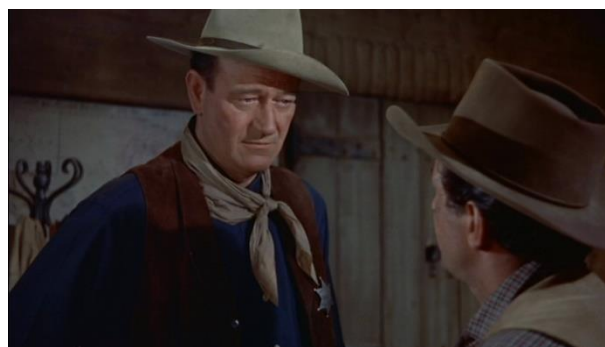
John Wayne sait s'entourer pour affronter l'ennemi dans Rio Bravo . 1959

Gary Cooper est très souvent seul dans le plan, dans Le train sifflera trois fois ; sa solitude et son désarroi se lisent sur son visage. A l'inverse, John Wayne, dans Rio Bravo , est très rarement seul dans les plans. Il est toujours en relation avec les autres personnages et ne semble jamais douter.