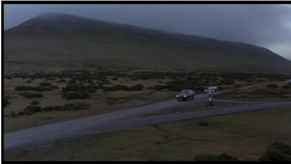
Ce plan fait écho au début du film. La voiture du médecin, parti à la recherche de la vérité, a remplacé la camionnette remplie de moutons.