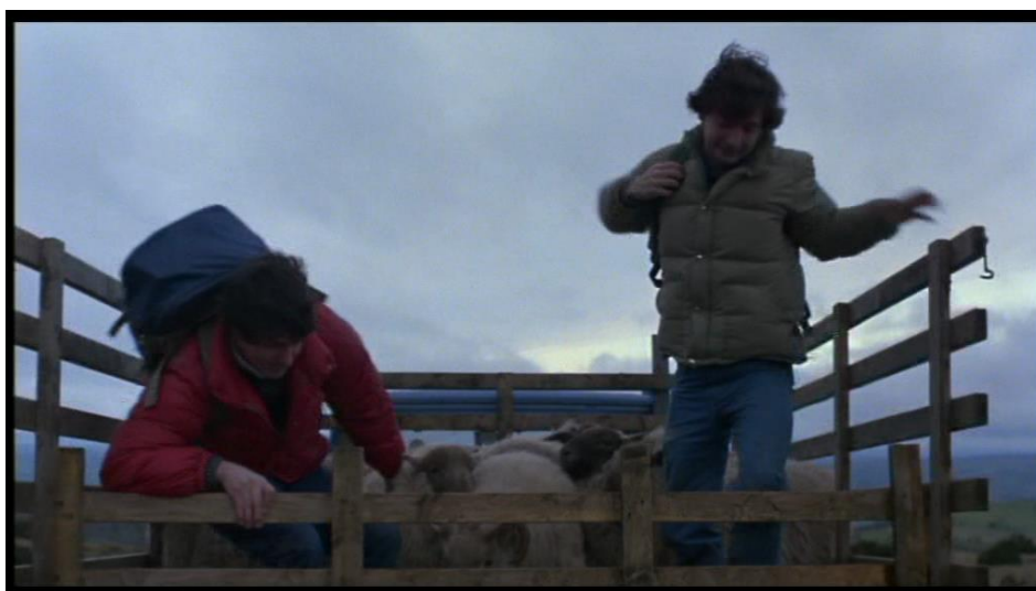
Deux jeunes gens descendent de la camionnette dans laquelle ils ont voyagé avec des moutons. Le parallèle avec les moutons est à souligner.