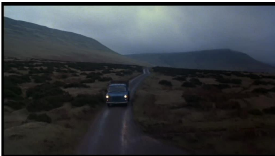
La profondeur de champ nous permet de voir approcher une camionnette.