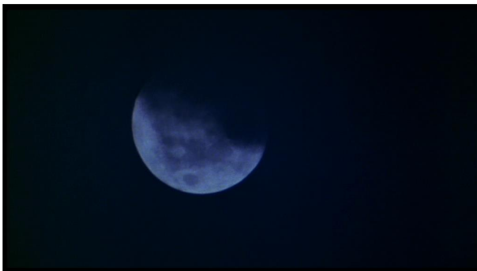
La menace se précise, la pleine lune se dévoile.