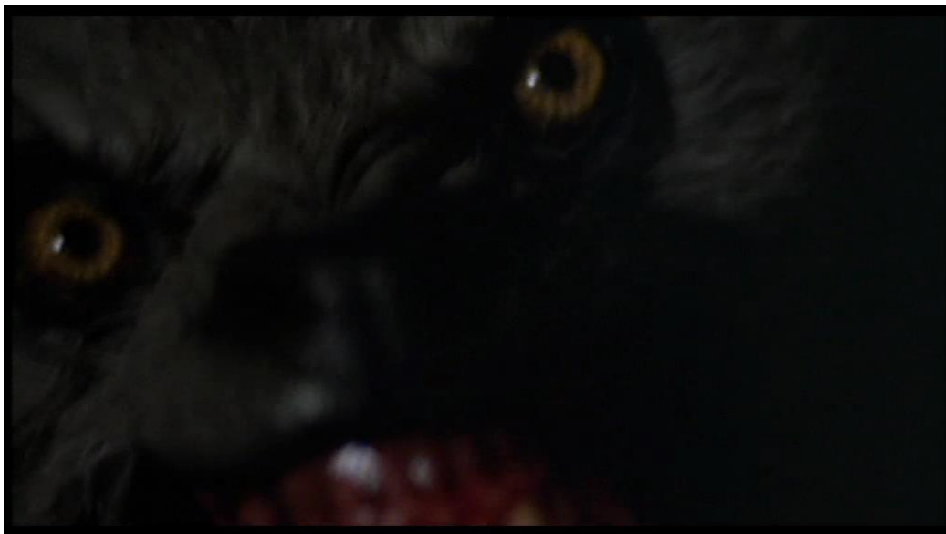
Le monstre apparaît rarement à l'image et toujours de manière fugace.