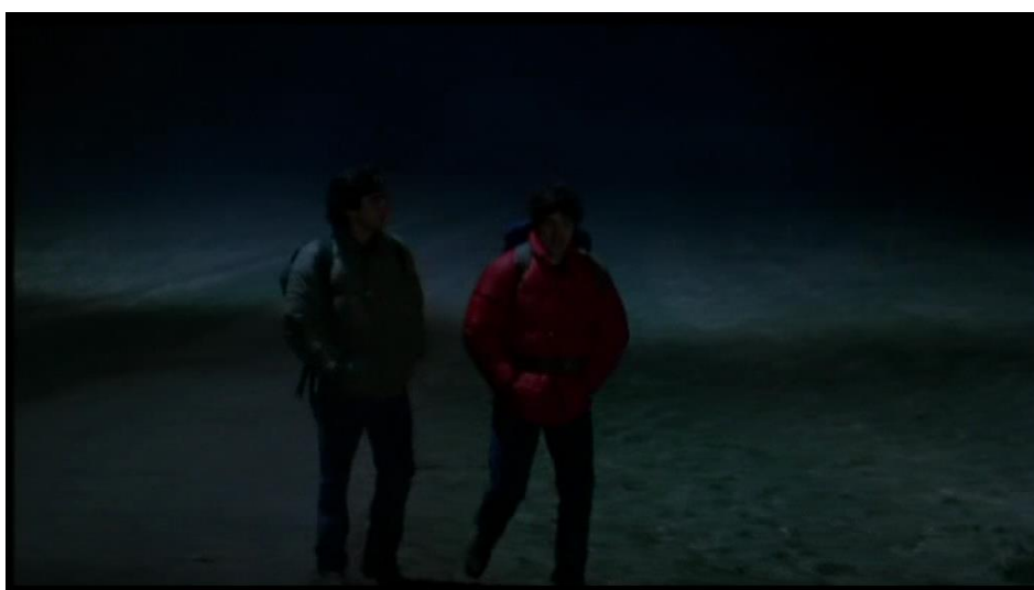
Contraints de quitter le pub, nos deux jeunes héros s'éloignent dangereusement du chemin et pénètrent dans la lande.