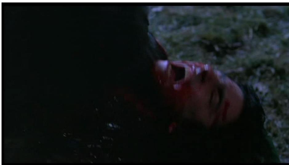
Trop tard, l'attaque s'est déjà produite.