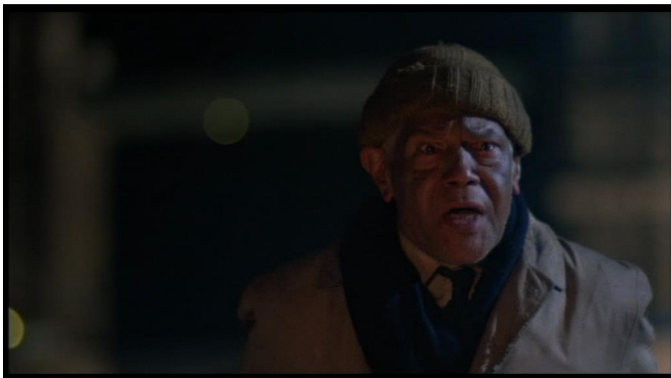
Ce gros plan sur le visage d'une victime laisse à deviner l'horreur qui se cache hors champ.