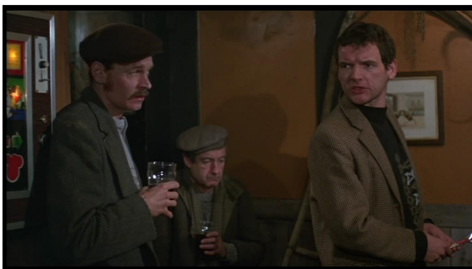
Dans le pub, certains sont torturés par leur conscience.