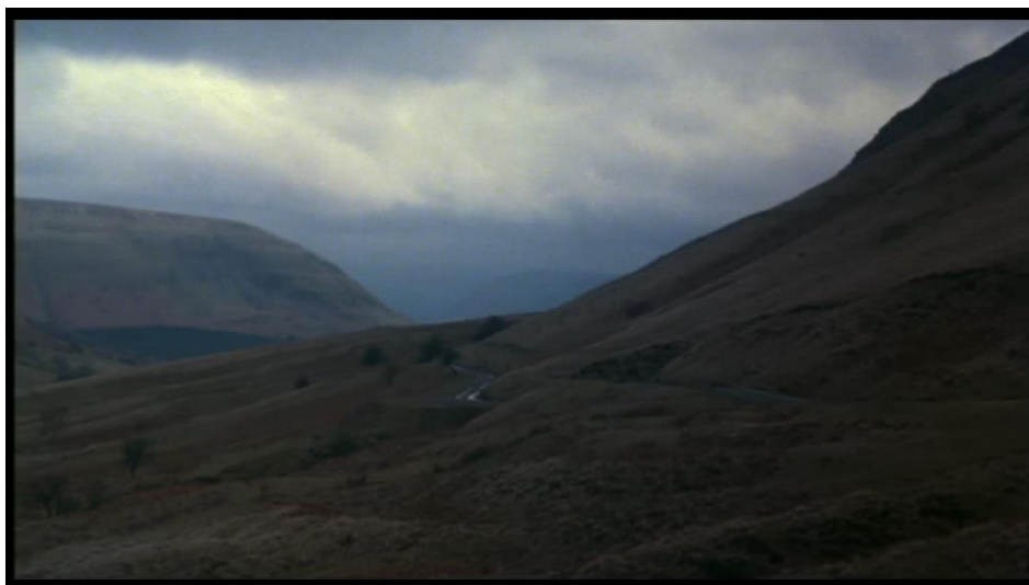
Le film s'ouvre sur la vue d'une lande anglaise, une vraie image de carte postale.