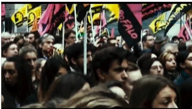
V.O., juillet 2016