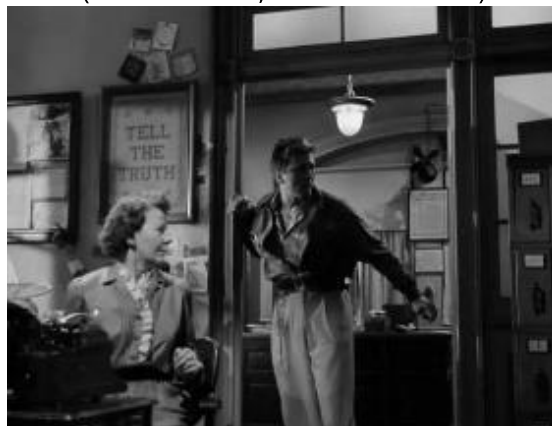
(Fin du film)