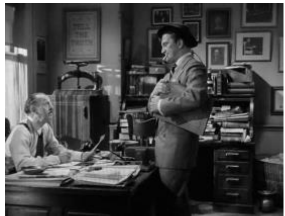
(Début du film, arrivée de Tatum)