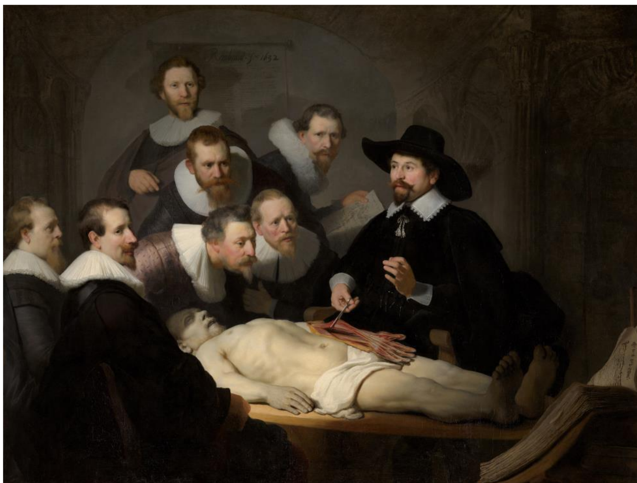
La leçon d’anatomie du Dr Tulp de Rembrandt (1632)

Le tableau de Rembrandt / « être avec les victimes », le credo professionnel d’André :